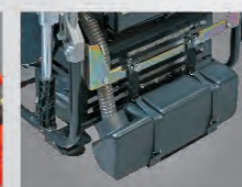
排水キャッチタンク