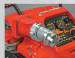
操法用根元媒介接手